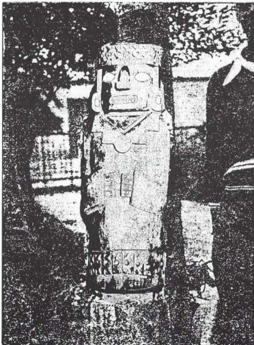
IDOLO de madera descubierto en el Cerro de la Horca 1934 por el General Frances Louis M. Langlois

psicotrópicos de " plantas alucinógenas hasta ahora no identificadas " bajo forma de emplastos producían un trance o viaje chamánico o peregrinación espiritual que de igual manera lo registra la Carta Anua acerca de la peregrinación sagrada de ida y regreso del Dios Vichama, no solo " hecho simbólico de peregrinaciones físicas " sino también espirituales que eran interpretados al usar psicotrópicos, también la ausencia de registros de ídolos simbólicos a diferencia de la Barranca antigua que "si" era bien relacionado al ritual de Vichama con la magia felinico - simbólico-mágico.