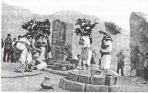
Wankas de Huaricanga - Paramonga Fig. 5