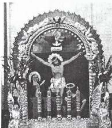
Señor de los Milagros Fig. 6