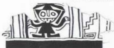
Fig. 02 Pativilca 4,220 años antig. aprox.

Ventarrón-Lambayeque Murales 4,000 años de antigüedad Contemporáneo a Caral