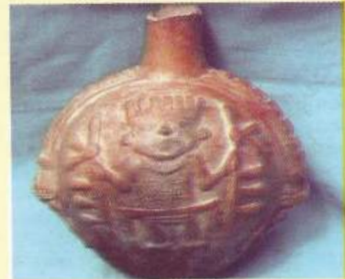
CABALLETE - PARAMONGA El más antiguo del Norte Chico (5,150 años)