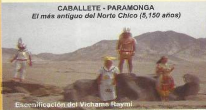
Escenificación del Vichama Raymi

APOYA AL PROYECTO DE LA RED DE MUSEOS DEL NORTE CHICO